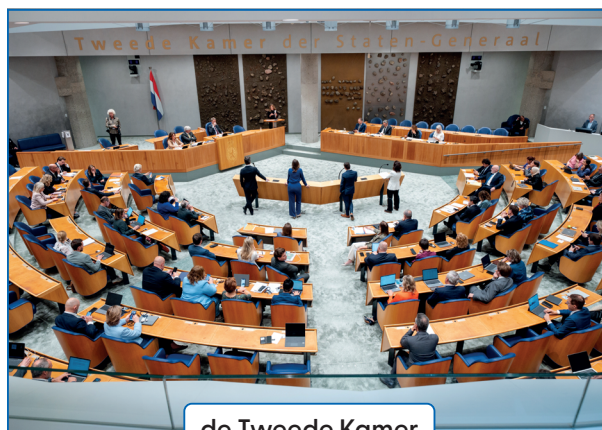
de Tweede Kamer

De leden van het parlement controleren het werk van de regering. Ze controleren bijvoorbeeld de nieuwe wetten die de regering maakt. Het parlement kan een wet dan aannemen of niet. De wetten gaan eerst naar de Tweede Kamer en daarna naar de Eerste Kamer. De leden van de Tweede Kamer mogen ook zelf voorstellen voor nieuwe wetten doen. Het parlement en de regering van Nederland zitten in Den Haag.