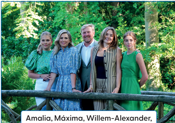
Amalia, Máxima, Willem-Alexander, Ariane en Alexia