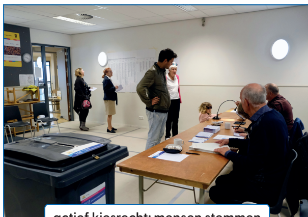
actief kiesrecht: mensen stemmen