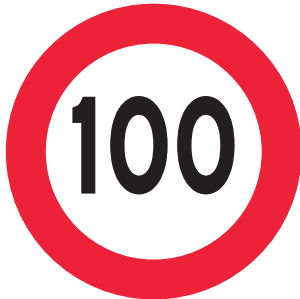
Niet harder dan 100.