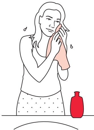
Els wast zich.