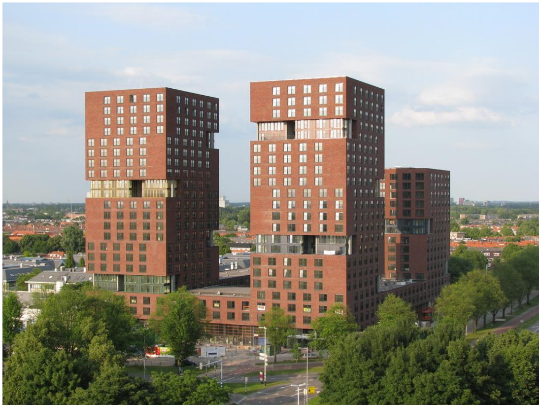
City Campus Max – Utrecht

Weet u wat de onderstreepte woorden in de tekst betekenen? Probeer ze met andere woorden in het Nederlands uit te leggen.