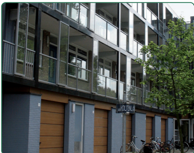
de flat (spreek uit: flet)